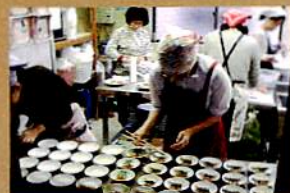
「おもてなし女子」の活動