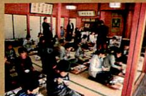
益田市立益田小学校ふるさと教育