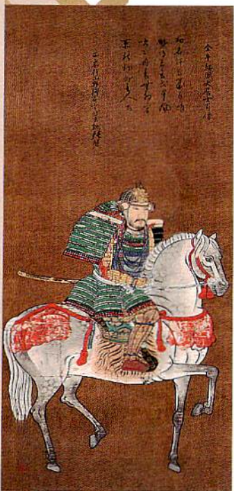
重要文化財 狩野松栄《益田元祥像》 鳥根県立石見美術館蔵

永禄11年(1568年)、益田(鳥根県益田市)の領主益田藤兼・元祥父子は、戦国大名毛利元就の本拠吉田郡山城(広島県安芸高田市)を訪れ、莫大な贈り物をすると同時に、豪華な料理を振る舞いました。益田藤兼はこの贈り物と料理によって、その実力を毛利元就に鮮明に印象づけました。この後、益田元祥が毛利元就の二男吉川元春の娘と結婚するなど、益田氏は毛利氏から一門に準じる扱いを受けて重く用いられ、江戸時代には長州藩の永代家老家となりました。